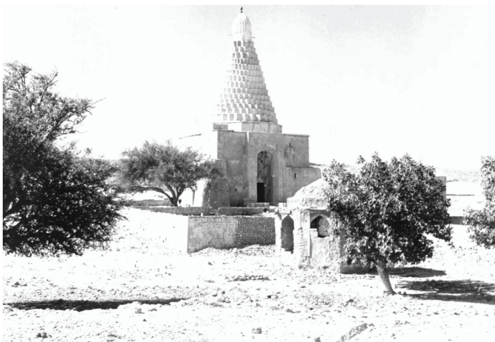
تصویر (۶): مقبره‌های محمد در جزیره خارگ