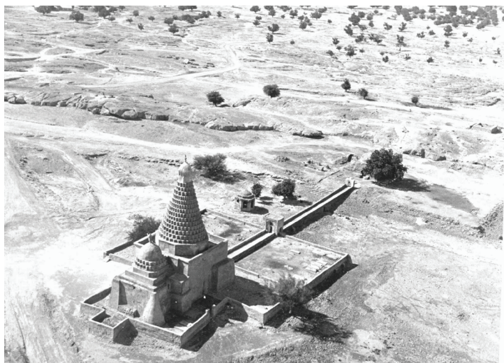
تصویر (۷): مقبره‌های محمد در جزیره خارگ