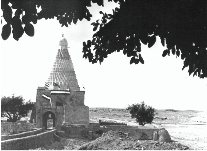
تصویر (۹): ثبت بقعه میر محمد حنفیه در فهرست آثار ملی کشور