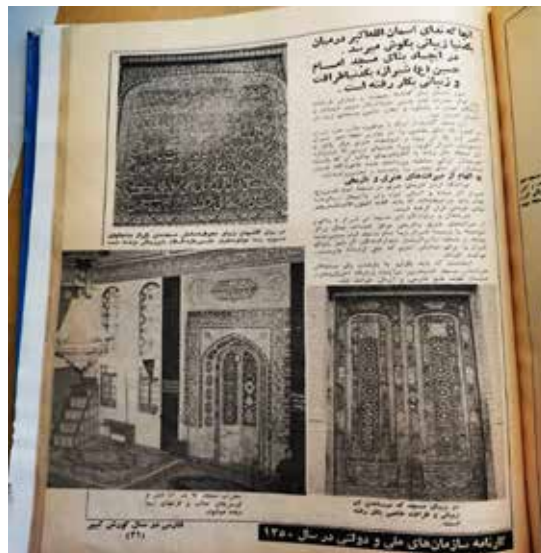
(کیهان سالانه، ۱۳۵۰: ۳۱)

سوم شعبان سال ۱۳۴۹ ه. ش، به میمنت و مبارکی و روز تولد امام حسین علیه السلام این مسجد زیبا افتتاح گردید. این مسجد گذشته از اینکه با موقعیت خاص خود نیاز و کمبود یک بنای مذهبی را در بهترین نقطه شهر شیراز تأمین نمود یک اثر زیبا و ارزشمند هنری دیگر به آثار و دیدنی‌های شیراز افزود؛ زیرا خشت‌های زربینی که در دیوارهای این مسجد به کار رفته با کاشی‌کاری‌های جالب آن که به دست هنرمندان ایرانی ساخته و پرداخته شده ناخودآگاه هر تماشاگری را به اندیشه و تحسین وامی‌دارد. روی هم رفته نمای مسجد و اسلوب ساختمان آن نشان می‌دهد که بانی آن سخت پایبند حفظ و حراست هنرهای باستانی بوده است و برای رسیدن به این محصول از صرف هرگونه هزینه خودداری نکرده و با دست و دل‌بازی در تهیه مصالح و لوازم مورد نیاز اقدام کرده و برای به کار گرفتن دست‌های هنرمند جهت احداث این بنای زیبا نظر تنگی از خود نشان نداده است. بانی این مسجد هیچ‌گاه ارزشی برای مال دنیا قائل نبوده و ثروت خداداد خود را پیوسته برای کارهای خیر به کار گرفته است. او با مسجدی که احداث کرده تنها به یک شبستان و محوطه نمازخانه برای عبادت خدا اکتفا نکرده بلکه با اندیشه‌های انسانی و افکار بلندی که داشته برای شکافتن تاریکی‌ها و روشنی بخشیدن به اندیشه‌ها با احداث یک کتابخانه بزرگ و مجهز گام دیگر در راه شناخت معارف الهی و تعلیمات آسمانی برداشته است (کیهان سالانه، ۱۳۵۰: ۳۳). در روی کاشی‌کاری‌های زیبای محوطه داخلی مسجد متن یکی از مناجات منسوب به مولای متقیان علی علیه السلام به زیبایی نوشته شده است.