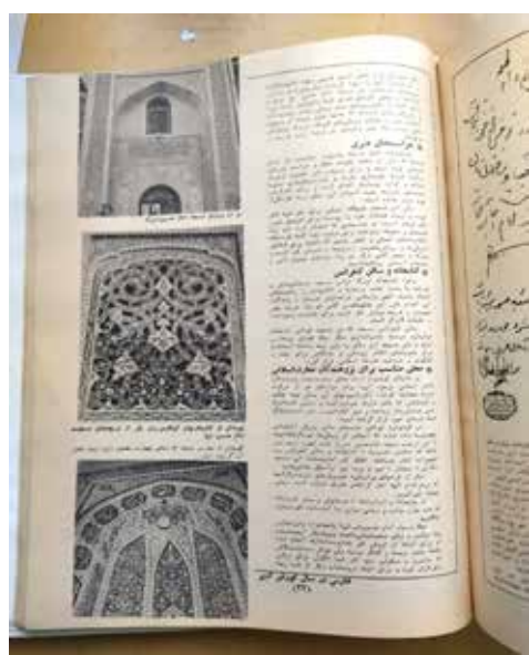
(کبهان سالانه، ۱۳۵۰: ۳۳).