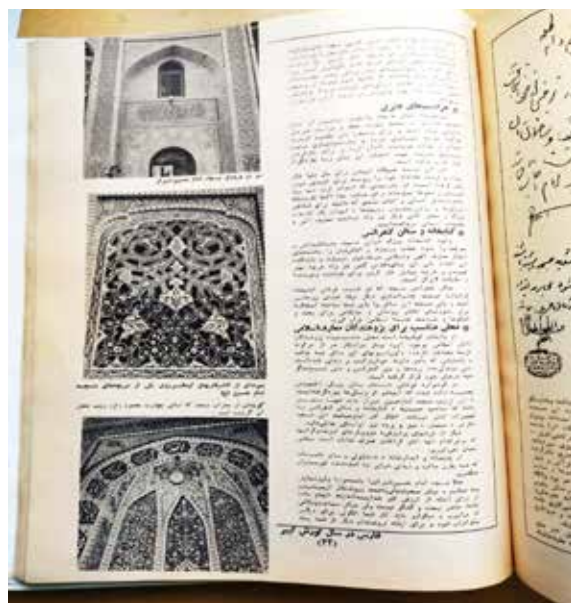
(کیهان سالانه، ۱۳۵۰: ۳۳).

محراب مسجد که در آن منبر و نورافشان‌های جالب و فرش‌های زیبا دیده می‌شود: