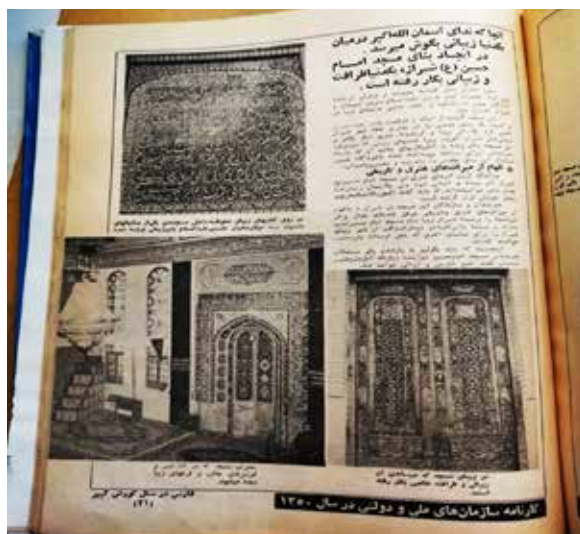
(کیهان سالانه، ۱۳۵۰: ۳۳).

محراب مسجد که در آن منبر و نورافشان‌های جالب و فرش‌های زیبا دیده می‌شود: